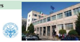
Politecnico di Torino